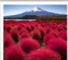
สวนโอะชิชิ ไร่ส้ม

วัดเมียวโตะจิน / ถนนเมียวโตะจิน โฮโมเตะชินโด / พิพิธภัณฑ์ชิราคาวาโกะ / ซินมาชิ ซูจิ / คามิโกจิ / สะพานกินปะ / สวนโอะชิชิ ไร่ส้ม / ทุ่งดอกไม้เนเป็ล / โอชิโนะ ซัททอ / สวนโอะชิชิ ไร่ส้ม / วัดอาซากุสะ / ตลาดปลาซึกิจิ / ซึบะบึงฮิมะรุคุ / มิดะซุเมะ ฮาเกะเค็ง พาร์ค คิซารุชิ