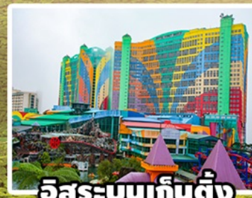
อิสระบนเก็นตัง