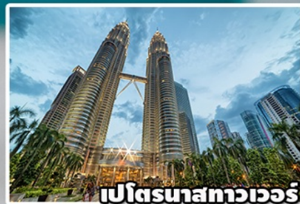
เปโตรนาสทาวเวอร์