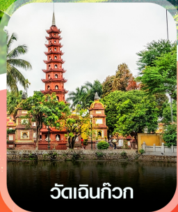
วัดอินทก๊วก

คอนเฟิร์มออกเดินทาง ทุกพีเรียด 2 ท่านขึ้นไป