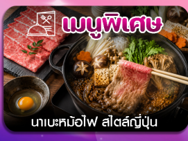
เมนูพิเศษ นาเบะคินอิโง สัตสึมันจู