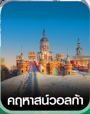
คฤหาสน์วอลก้า