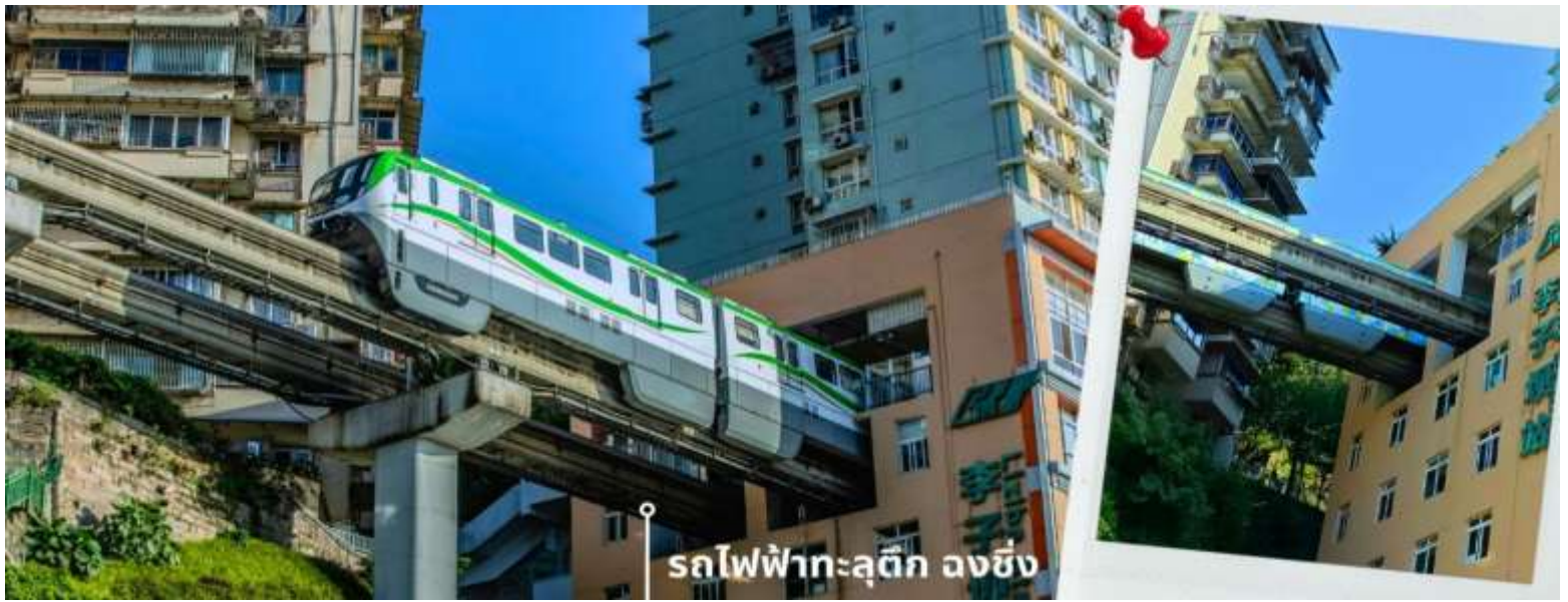
รถไฟฟ้าทะลุตึก ลงชิง

นำท่านเดินทางสู่ ศาลาประชาชน (ด้านนอก) เป็นสถานที่หนึ่งในสัญลักษณ์ของเมืองฉงชิ่ง ด้วยสีส้มและรูปแบบการจัดวางอย่างโดดเด่นและลงตัว มีการผสมผสานของศิลปะในยุคราชวงศ์หมิงและราชวงศ์ชิงเข้าไว้ด้วยกัน ด้านหน้าจะเป็นลานกว้างหน้า 4 CHUCKG3 ฉงชิ่ง อุ่หลง หลุมฟ้า ต้าจู้ หยงหยาดัง 5 วัน 4 คืน บิน HAINAN AIRLINES (HU) ในตอนเย็นและตอนกลางคืนจะมีผู้คนจำนวนมากเข้ามารวมตัวกันทำกิจกรรม ไม่ว่าจะเป็นการเต้นแอโรบิค เดินเล่น ปิกนิก เดินชมแสงไฟยามค่ำคืน จัดนิทรรศการต่างๆ