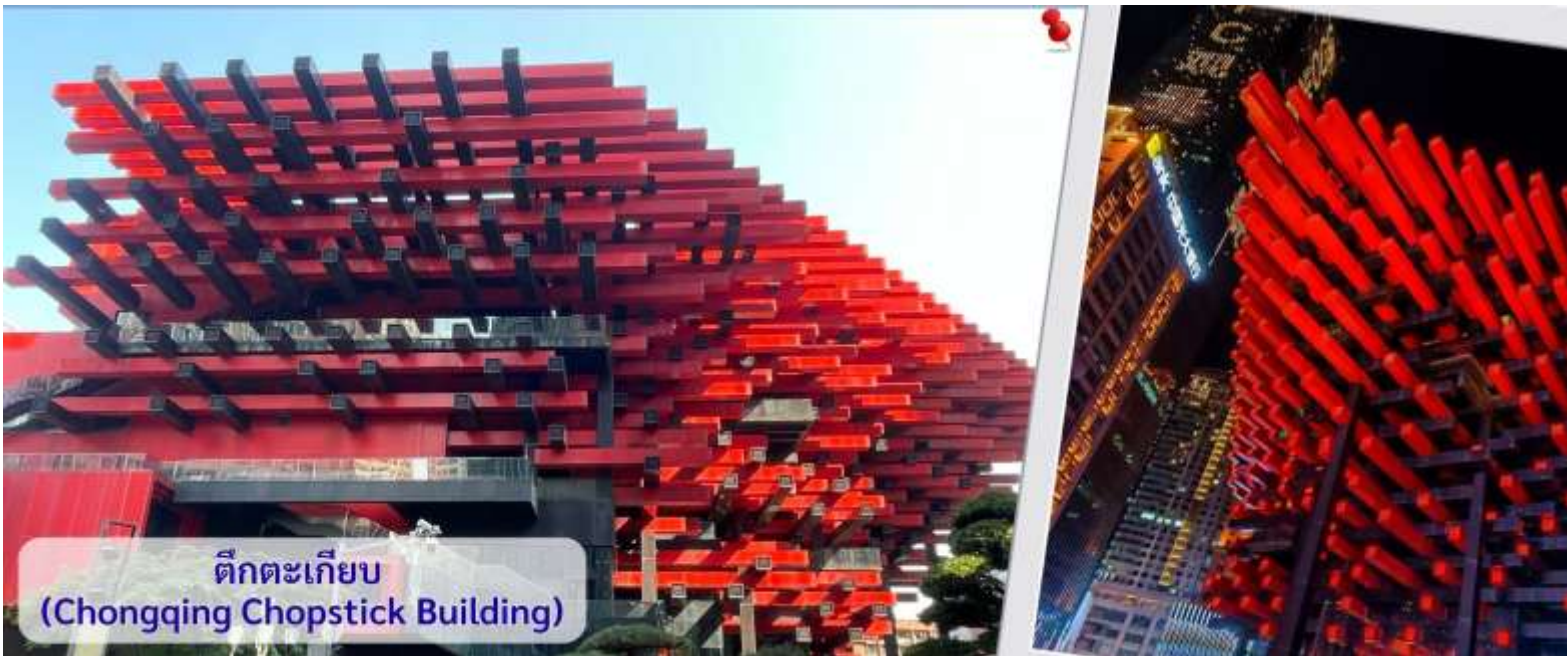
ตึกตะเกียบ (Chongqing Chopstick Building)

จากนั้นอิสระถ่ายรูปหน้า ตึกตะเกียบ ฉงชิ่ง(ด้านนอก) คือ ฉงชิ่งกั๋วไต่อาร์ตเซ็นเตอร์ (Chongqing Guotai Arts Center) เป็นแลนด์มาร์กสำคัญที่มีสถาปัตยกรรมคล้ายตะเกียบยักษ์สีแดงและดำวางซ้อนกัน เป็นศูนย์จัดแสดงงานศิลปะและสถานที่ท่องเที่ยวที่นิยมสำหรับการถ่ายรูป โดยเฉพาะในเวลาากลางคืนเมื่อเปิดไฟสวยงาม สิ่งก่อสร้างอันมีเอกลักษณ์ อาคารนี้ถูกวางโครงสร้างให้มีรูปร่างคล้ายกอง "ตะเกียบยักษ์" สีดำและแดงที่วางซ้อนกันเป็นชั้นๆ ที่ส่วนปลายของตะเกียบสีแดงจะมีตัวอักษรจีนคำว่า "กั๋ว" ประทับอยู่ ซึ่งมีความหมายถึง ชาติหรือประเทศ ส่วนที่ปลายตะเกียบสีดำ จะมีอักษรจีนคำว่า "ไต่" ประทับอยู่ ซึ่งหมายถึง ความเจียบสงบ หรือความอุดมสมบูรณ์