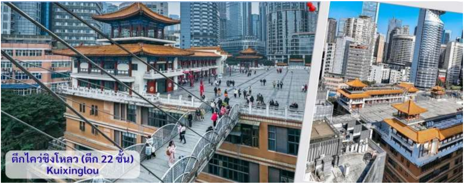
ตึกไควซิงโหลว (ตึก 22 ชั้น) Kuixinglou