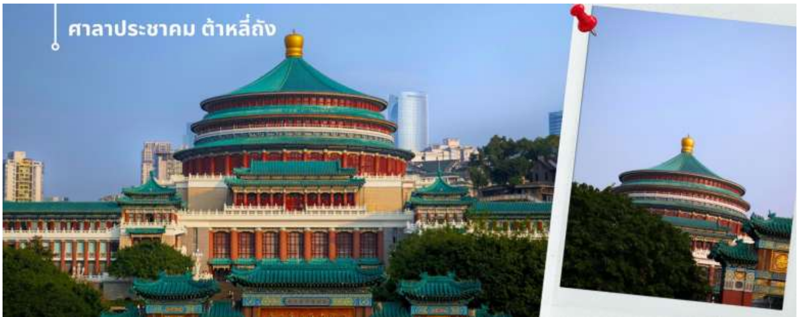
ศาลาประชาชน ต้าหลี่ถิง

นำท่านเดินทางสู่ ศาลาประชาชน (ด้านนอก) เป็นสถานที่หนึ่งในสัญลักษณ์ของเมืองฉงชิ่ง ด้วยสีส้มและรูปแบบการจัดวางอย่างโดดเด่นและลงตัว มีการผสมผสานของศิลปะในยุคราชวงศ์หมิงและราชวงศ์ชิงเข้าไว้ด้วยกัน ด้านหน้าจะเป็นลานกว้างหน้า 4 CHUCKG3 ฉงชิ่ง อุ่หลง หลุมฟ้า ต้าจู้ หยงหยาดัง 5 วัน 4 คืน บิน HAINAN AIRLINES (HU) ในตอนเย็นและตอนกลางคืนจะมีผู้คนจำนวนมากเข้ามารวมตัวกันทำกิจกรรม ไม่ว่าจะเป็นการเต้นแอโรบิค เดินเล่น ปิกนิก เดินชมแสงไฟยามค่ำคืน จัดนิทรรศการต่างๆ