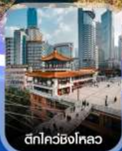
ตึกไควซิงโหลว

✈️ คอนเฟิร์มออกเดินทาง ทุกพีเรียด 2 ท่านขึ้นไป