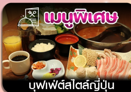
บุฟเฟ่ต์สไตล์ญี่ปุ่น

ซัปโปโร-ชมทุ่งดอกลาเวนเดอร์-โทมิตะฟาร์ม-ชิชิโนะโอะกะ-น้ำตกชิราอิเกะ-บ่อน้ำสีฟ้า-อีสระซ็อบบั้งเต็มวัน-ฟักออนเซน