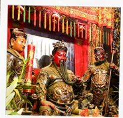
เทพเจ้ากวนอู วัดถนูนไท่