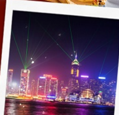
ชมโชว์ SYMPHONY OF LIGHT