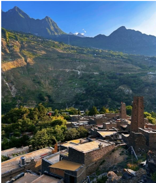
หมู่บ้านโบราณเซียงถ้ำผิง (Taoping Qiang Village)

อนุรักษณ์ไว้ดีที่สุดของชนเผ่าเซียง (Qiang) ที่นี้มีความโดดเด่นไม่เหมือนใครด้วยสถาปัตยกรรมแบบ "ป้อมปราการหิน" ซึ่งเป็นเอกลักษณ์ของชนเผ่านี้ ทำให้หมู่บ้านดูเหมือนเขาวงกตที่ซับซ้อนและน่าค้นหา เมื่อก้าวเข้าสู่ถ้ำผิงเซียงจ่าย คุณจะรู้สึกเหมือนได้ย้อนเวลากลับไปในอดีต บ้านเรือนและกำแพงทุกหลังสร้างจากหินล้วน ๆ โดยไม่ใช้ปูนซีเมนต์ แต่ใช้หินซ้อนกันอย่างมีศิลปะจนกลายเป็นโครงสร้างที่มั่นคงและแข็งแรง ระบบการออกแบบหมู่บ้านยังมีความซับซ้อนด้วยทางเดินใต้ดินและทางเดินบนหลังคาที่เชื่อมต่อถึงกัน ทำให้เกิดเป็นเขาวงกตที่สามารถใช้หลบภัยและป้องกันศัตรูในสมัยโบราณได้ มีระบบส่งน้ำใต้ดินและบนดินที่ชาญฉลาด น้ำไหลทั่วถึงทุกครัวเรือน ได้ชื่อว่า "หมู่บ้านที่ไม่เคยขาดน้ำ" จากนั้นนำท่านเดินทางสู่ เมืองเฉิงตู (Chengdu, 成都)