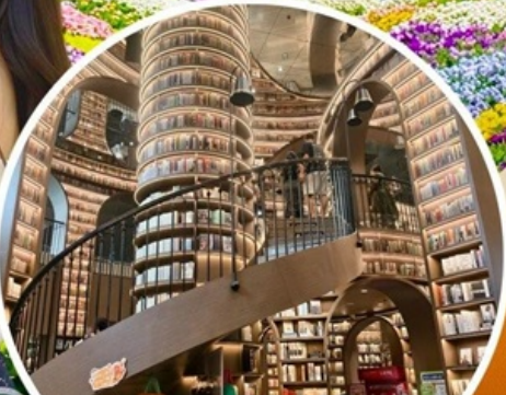
จงซูเก๋อ