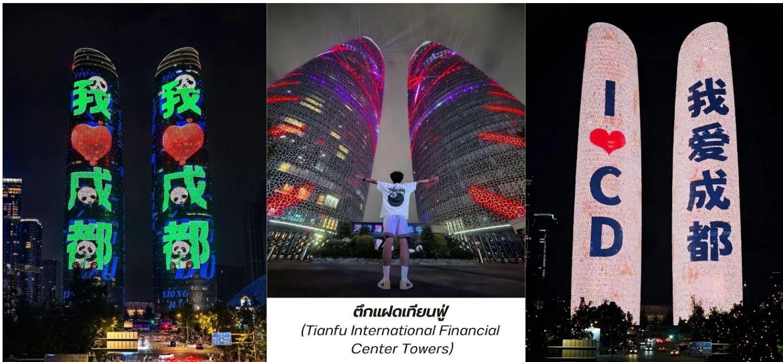
ตึกแฝดเทียนฟู่ (Tianfu International Financial Center Towers)

นำท่านเดินทางกลับสู่โรงแรมที่พัก ระหว่างทางนำท่านแวะชมแสงสีถ่ายรูปลักษณ์นอก ตึกแฝดเทียนฟู่(Tianfu International Financial Center Towers,天府双塔) สัญลักษณ์แห่งความทันสมัยและความก้าวหน้าของเมืองเฉิงตู ตึกระฟ้าแฝดแห่งนี้ตั้งตระหง่านอยู่ใจกลางย่านการเงินแห่งใหม่ ตึกแฝดเทียนฟู่ มีความสูงกว่า 220 เมตร แต่ละตึกมีดีไซน์ที่โดดเด่นและเป็นเอกลักษณ์ โดยเฉพาะในยามค่ำคืนค่าคืน ตัวอาคารจะถูกประดับ ประดาด้วยไฟ LED ที่สว่างไสว ทำให้เกิดการแสดงแสงสีที่สวยงามตระการตา