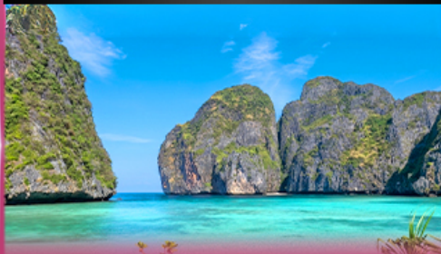
ทัวร์เกาะพีพี