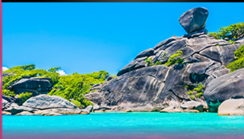
ทัวร์เกาะสิมิลัน