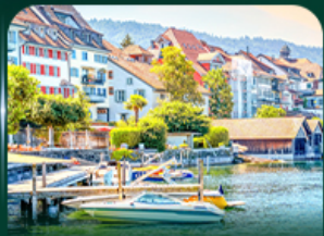
เมืองสวยริมทะเลสาบ ชุก