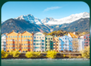
อาคารสีลูกกวาด อินส์บรุค