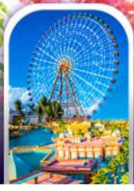
เมืองแฟนตาซี