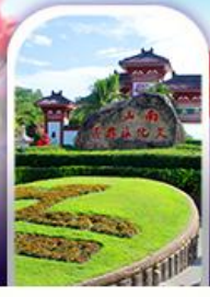
อุทยานหนานชาน