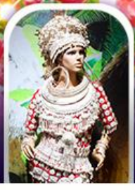
หมู่บ้านชนเผ่า