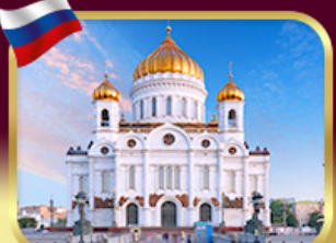
มหาวิหารเซนต์ซาเวียร์