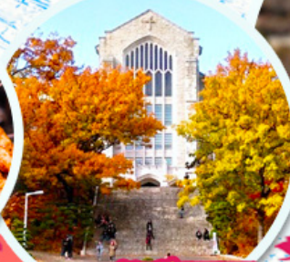
มหาวิทยาลัยฮิวา