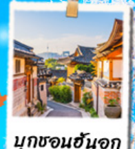
มูกซอนฮันอก