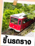
ชั้นรถราง