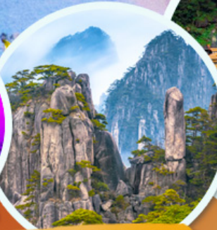
ภูเขาหวงชาน