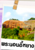
พระนอนอภัย