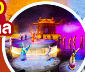
ชมโชว์อสังการ