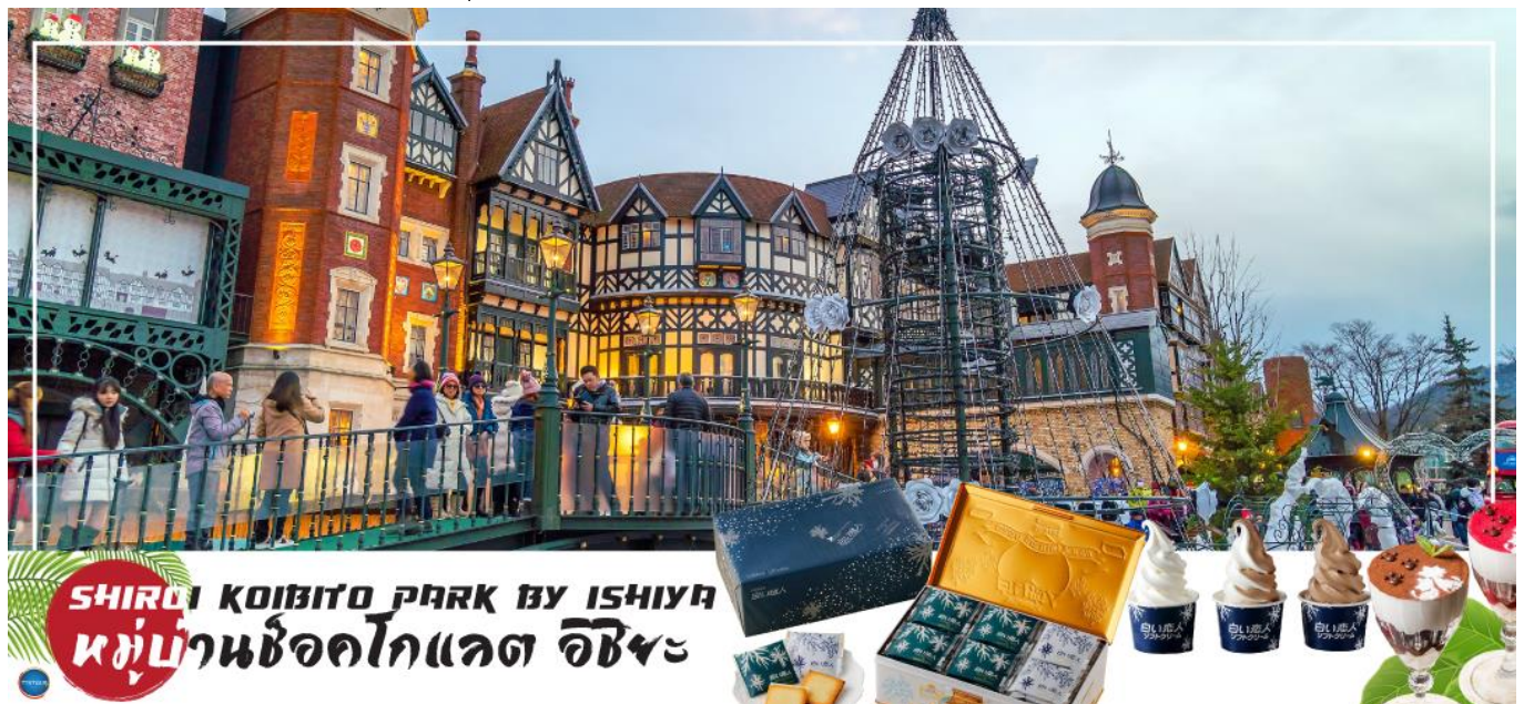
SHIROI KOIBITO PARK BY ISHIYA หมู่บ้านช็อคโกแลต อิชิยะ

จากนั้นนำท่านเดินทางสู่ เมืองซัปโปโร (SAPPORO) (ใช้เวลาเดินทางประมาณ 1.20 ชั่วโมง) นำท่านสู่ หมู่บ้านช็อคโกแลต อิชิยะ (Shiroi Koibito Park by Ishiya) (ด้านนอก) แหล่งผลิตช็อคโกแลตที่มีชื่อเสียงของญี่ปุ่น ตัวอาคารของ โรงงานถูกสร้างขึ้นในสไตล์ยุโรป แวดล้อมไปด้วยสวนดอกไม้ จึงทำให้บรรยากาศของหมู่บ้านช็อคโกแลตที่นี่ดูคลาสสิกและน่ารักไปอีกแบบ ช็อคโกแลตที่ขึ้นชื่อที่สุดของที่นี่คือ Shiroi Koibito ซึ่งมีความหมายว่าช็อคโกแลตขาวแต่คนรัก ท่าน