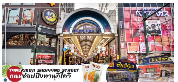
TANUKIKOJI SHOPPING STREET ถนนช้อปปิ้งทานุกิโคจิ

ร้านค้าต่างๆ อย่างร้านขายกิโมโน เครื่องดนตรี วิดีโอ โรงภาพยนตร์แล้ว ยังมีร้านอาหารมากมาย ทั้งยังเป็นศูนย์รวมของเหล่าวัยรุ่นด้วย เนื่องจากมีเกมเซนต์อร์ และตู้หนีบตุ๊กตามากมาย ร้านดองกิร้าน 100 เยน นอกจากนั้นที่นี่ยังมีการตกแต่งบนหลังคาด้วยตุ๊กตาทานุกิขนาดใหญ่ และเนื่องจากร้านค้าส่วนใหญ่มีหลังคาคลุม ดังนั้น ไม่ต้องกังวลเรื่อง ฝนหรือหิมะ ท่านสามารถช้อปปิ้งได้อย่างเพลิดเพลิน