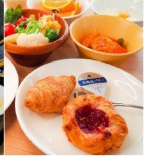
Smile Hotel Premium - Sapporo Susukino