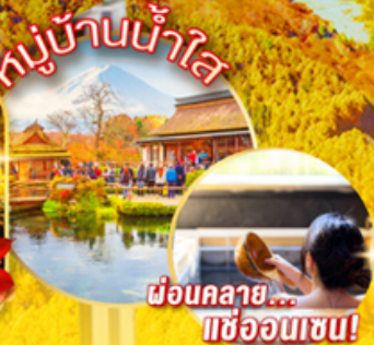
ช้อนคลาย... แช่ออนเซน!