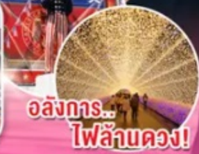
อลังการ...ไฟลั่นดวง!

โตเกียว!! อลังการไฟลั่นดวง ณ หมู่บ้านนาบาระ โนะ ซาโตะ ชม หมู่บ้านมรดกโลกการ์นิคิโดย UNESCO ณ หมู่บ้านชิราคาวาโกะ ชม วัดเนียวไดอิน แห่งอุจิวะเป็นมรดกโลกที่มีประวัติยาวนานหนึ่งพันปี หมู่บ้านอเมริกา มูระ ย่านวัยรุ่นที่รวมร้านค้าแฟชั่นสไตล์ตะวันตกไว้มากที่สุด ช้อปปิ้งจุใจ ย่านชินโซบาชิ พร้อมเช็คอิน ป้ายกูลิโกะแมน แห่งโดทงโบริ