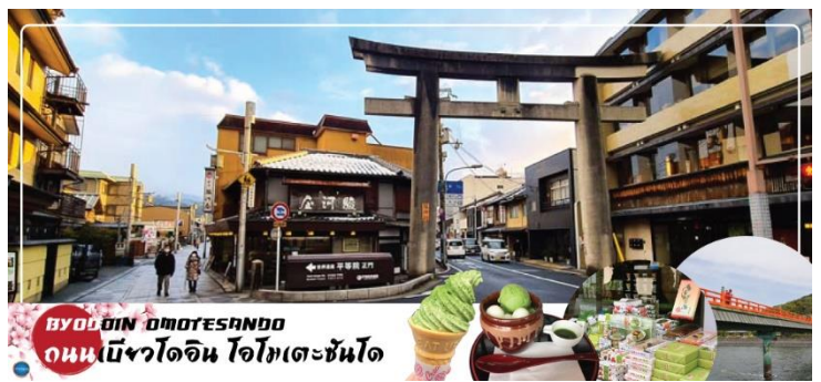
BYODOIN OMOTESANDO ถนนเบียวโดอิน โอโมเตะซันโด

รสชาเขียวทั้งหมด เมื่อท่านเดินทางสุดถนนแล้ว จะเจอ สะพานอุจิ (Uji Bridge) หนึ่งในสามสะพานเก่าแก่ที่สุดในญี่ปุ่น สร้างขึ้นในปี ค.ศ. 646 อายุคร่าวๆ ประมาณ 1,370 ปี เกือบพังทลายมาแล้วหลายครั้งจากสงคราม น้ำท่วม และแผ่นดินไหว แต่ทุกครั้งชาวเมืองก็ร่วมพลังกันซ่อมแซมจนกลับมาใช้งานได้อีกครั้ง และยึดหยัดมาจนถึงวันนี้ กลายเป็นมรดกทางประวัติศาสตร์ของชาวเมืองอุจิ