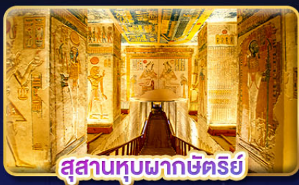
สุสานทูปพากซ์ตรีย์