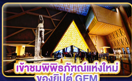
เข้าชมพิพิธภัณฑ์แห่งใหม่ ของยิปต์ GEM