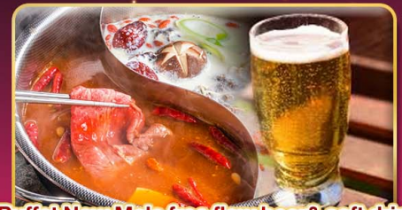
*Buffet New Mala free flow beer & soft drink