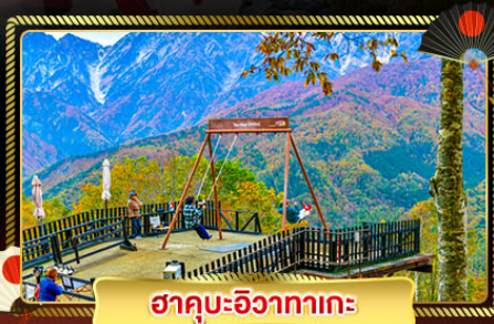
ฮาคูะอิซากาเตะ