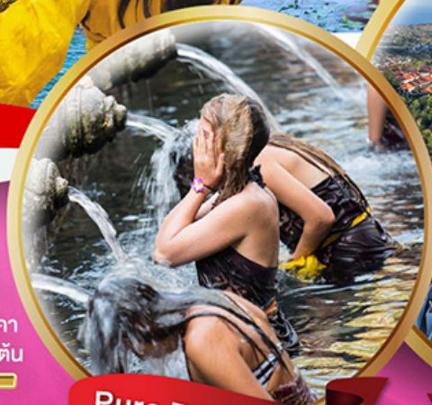
Pura Tirta Empul