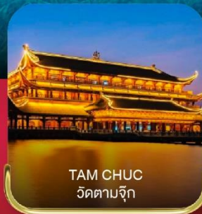
TAM CHUC วัดตามจึก