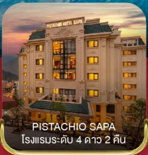
PISTACHIO SAPA โรงแรมระดับ 4 ดาว 2 คืน