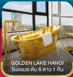
GOLDEN LAKE HANOI โรงแรมระดับ 5 ดาว 1 คืน