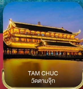
TAM CHUC วัดตามจุก