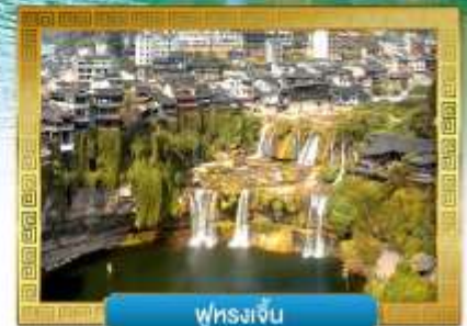
พูหวงเจี้ยน