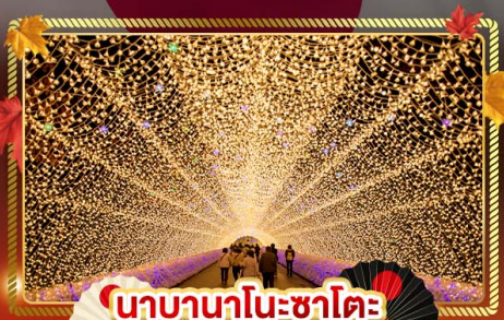
นาคานาโนะซาโตะ

"ชมความงามของฤดูใบไม้เปลี่ยนแล้ว" เที่ยวครบจบทุกไฮไลท์ โอซาก้า-โตเกียว พิเศษ!! บินแอร์แบบ FULL SERVICE