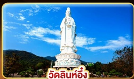
วัดลินห์ต็อง