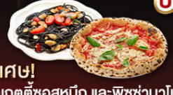
พิเศษ! สปาเกตตี้ซอสหมัก และพิซซ่านาโปลี