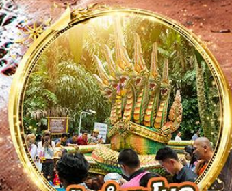
ปากำชะโนด