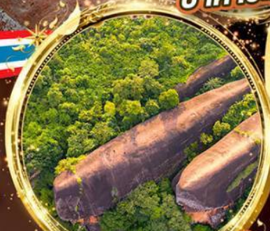
หินสามวาฬ