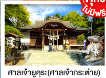
ศาลเจ้าคุระ (ศาลเจ้ากระต่าย)

พิเศษบุฟเฟ่ต์ซาบุดะพรีเมียม ปูออกโทโด อาหารทะเล เนื้อวากิว สเต็ก ซูชิโอคุระ และเครื่องดื่มไม่อั้น