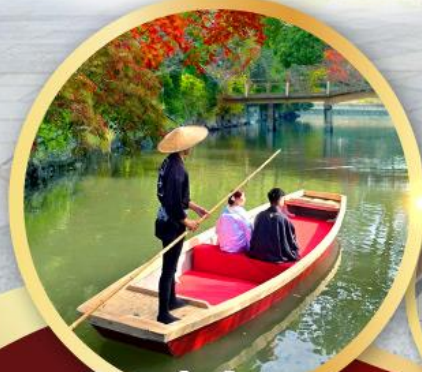
กิจกรรมล่องเรือยามากาวะ