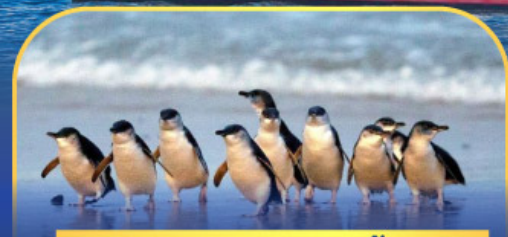
พาหรรณกเพนกวิน