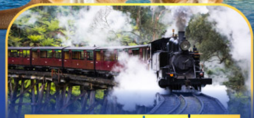
รถไฟพัพพิงบิลลี่

ล่องเรือชมอ่าวซิดนีย์พร้อมรับประทานอาหารกลางวัน และ เข้าชมสวนสัตว์การองก้า