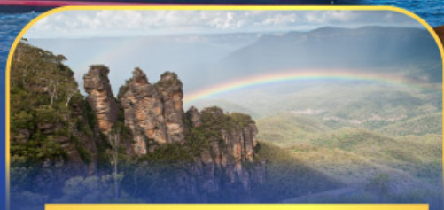
อุทยานแห่งชาติบลูเมาท์เทนส์ Three Sister Rock