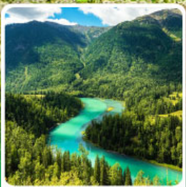
ทะเลสาบคานาสีอ