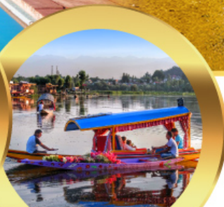
ล่องเรือซิคาร์่า