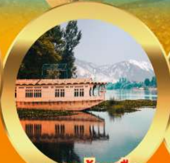
นอนบ้านเรือ วิวเขาหิมาลัย