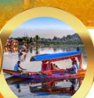
ล่องเรือซิคาร์่า