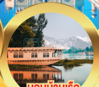
นอนบ้านเรือ วิวเขาหิมาลัย