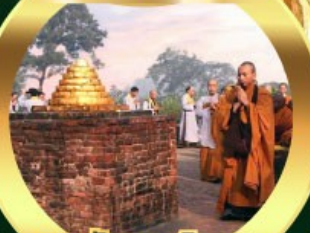
เขตนันทาวีหาร เมืองสาวัตถี