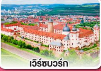
เว็ร์ชบวร์ค