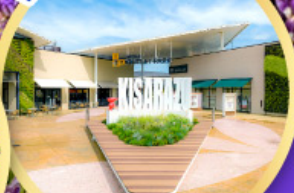
มิตซูเอะอิเกะ พาร์ค คิซะระซุ