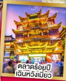
ตลาดร้อยปี เงินหั่งเมี่ยว