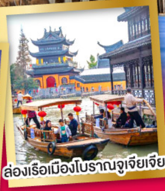
ล่องเรือเมืองโบราณซูโจวเจียว