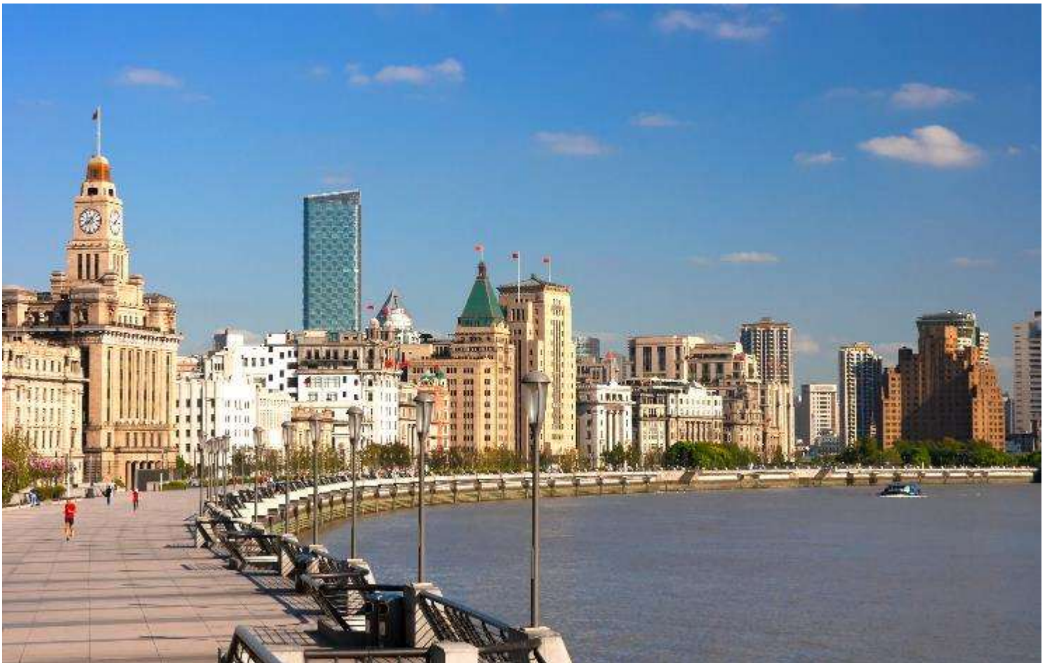
GO1PVG-CA009 ตะลอนเซี่ยงไฮ้ดิสนีย์แลนด์ อู๋ซี ซูโจว 5วัน 3คืน โดยสายการบิน Air China (CA)

จากนั้นนำท่านสู่บริเวณ หาดไวทาน ตั้งอยู่บนฝั่งตะวันตกของแม่น้ำหวงผู้มีความยาวจากเหนือจรดใต้ถึง4กิโลเมตร ถือเป็นสัญลักษณ์ที่โดดเด่นของนครเซี่ยงไฮ้อีกทั้งถือเป็นศูนย์กลางทางด้านการเงินการธนาคารที่สำคัญแห่งหนึ่งของเซี่ยงไฮ้ตลอดแนวยาวของหาดไวทานเป็นแหล่งรวมศิลปะสถาปัตยกรรมที่หลากหลาย เช่น สถาปัตยกรรมแบบโรมันโกธิคबारอครวมทั้งการผสมผสาน ระหว่างสถาปัตยกรรมตะวันออก-ตะวันตกเป็นที่ตั้งของหน่วยงานภาครัฐเช่น กรมศุลกากร โรงแรม และสำนักงานใหญ่ของธนาคารต่างชาติเป็นต้น