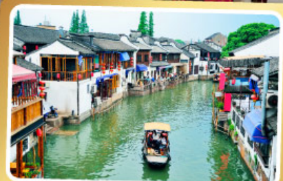
เมืองโบราณจู่เจียเจี้ยว