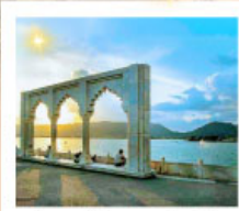
Ana Sagar Lake