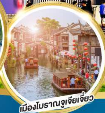
เมืองโบราณจูเจียเจี้ยว