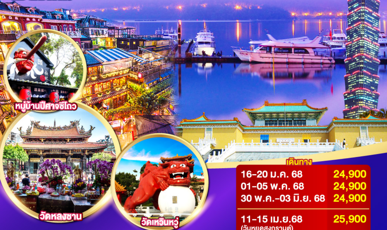
หมู่บ้านปิตาจซีโก

ล่องเรือทะเลสาบสุริยันจันทรา, จิวเฟิ่น, หมู่บ้านปิตาจ, พิพิธภัณฑ์แห่งชาติกู้กง