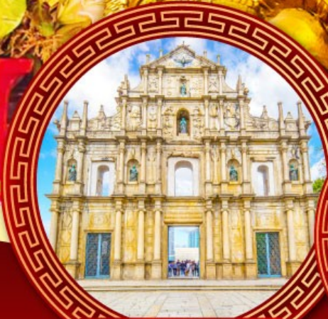
โบสถ์เซ็นต์ปอล