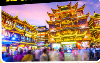
ตลาดร้อยปีเฉิงหวังเมี่ยว