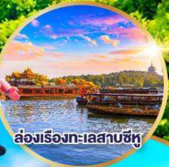
ล่องเรือทะเลสาบซีหู