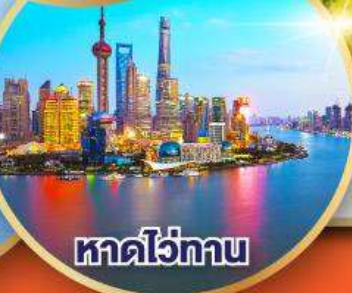
หาดไว่ทาบ