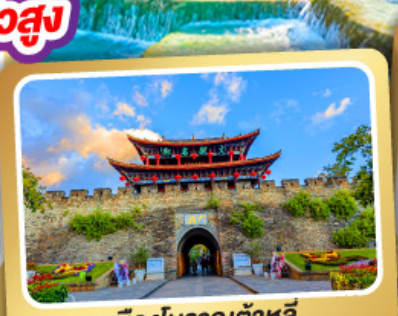
เมืองโบราณต้าหลี่