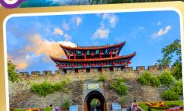
เมืองโบราณต้าหลี่