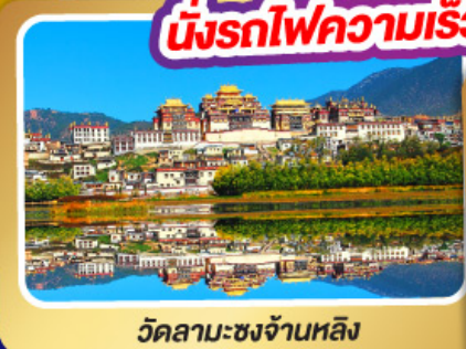
วัดลามะชงจ้านหลิง