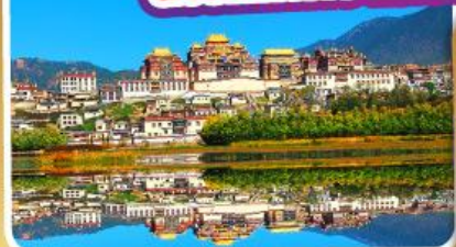
วัดลามะชงจ้านหลิง