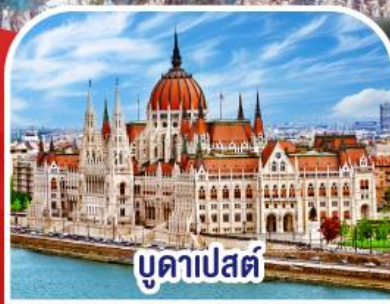
บูดาเปสต์

✓ พักอัลสตัท ✓ ขึ้นยอดเขาชุกสปีตซ์ เริ่มต้น TOP OF GERMANY